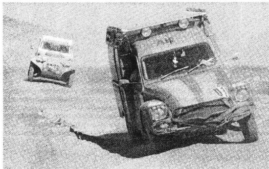
Een indrukwekkende tocht.

Irma was blij verrast met de cheque en vertelde, dat het geld gebruikt gaat worden voor het Community Based Aids Program in Morgenster te Zimbabwe en in het bijzonder voor weeskinderen. “Met dit geld kunnen zij ook naar school en onderwijs volgen. Bovendien kunnen we hier weer heel wat lesmateriaal van aanschaffen.”